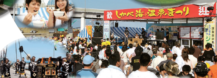
鹿部高爾夫鄉村俱樂部